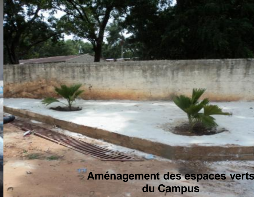
Aménagement des espaces verts du Campus