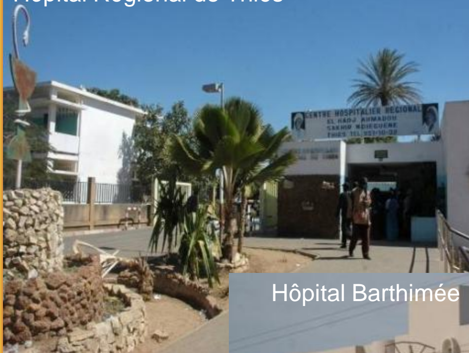
Hopital Regional de Thiès