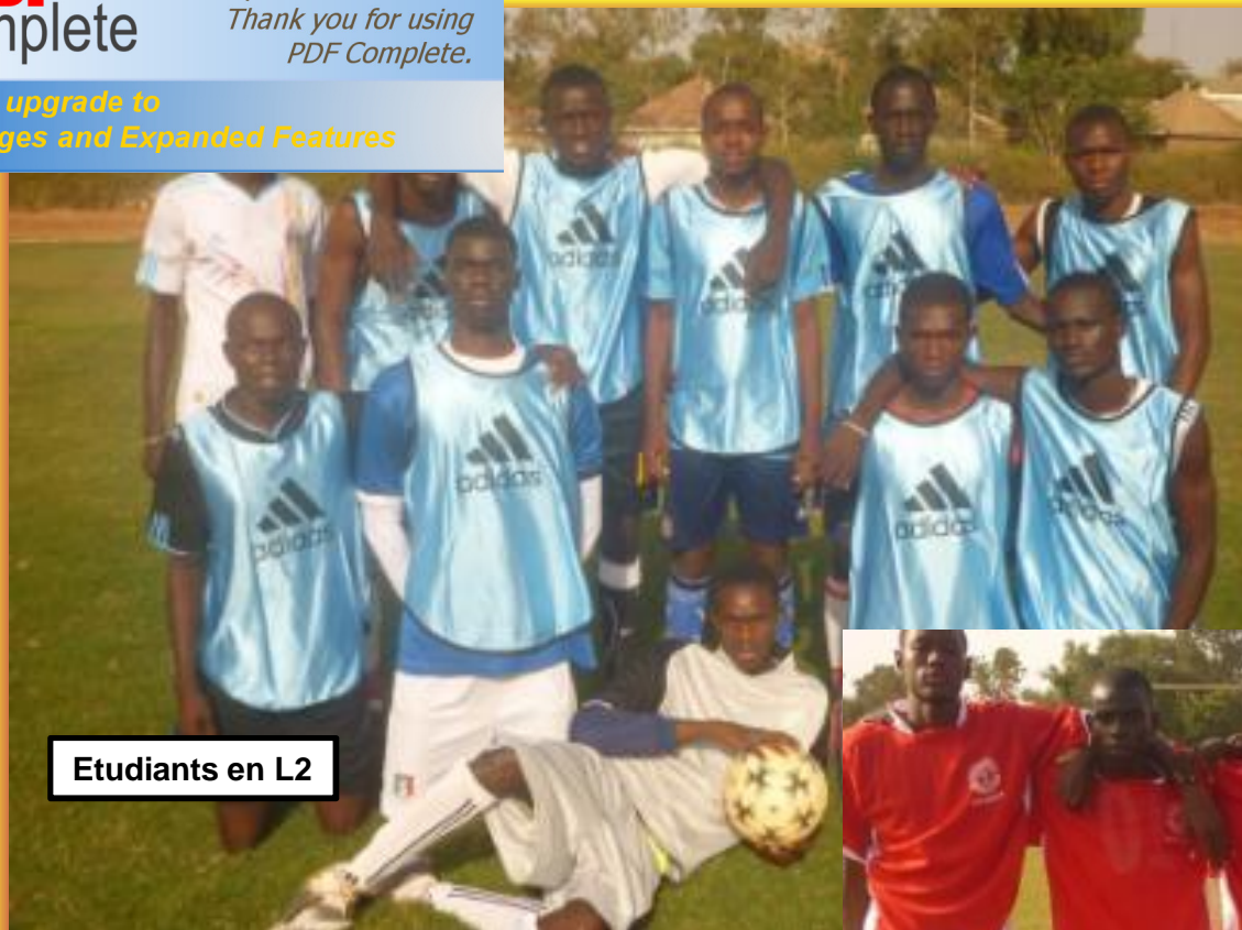
Etudiants en L2