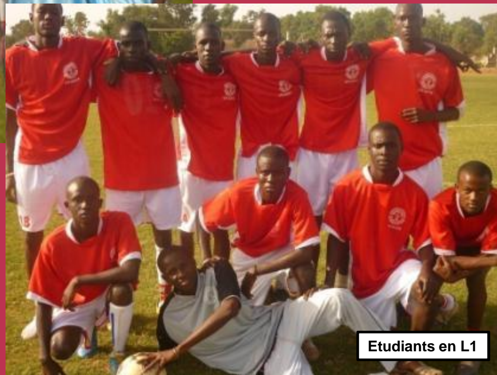
Etudiants en L1